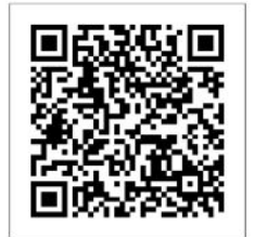
ルン公式ページ(携帯用)

②「チケットのお申し込み」をクリックして、 必要事項をご入力の上、送信してください。